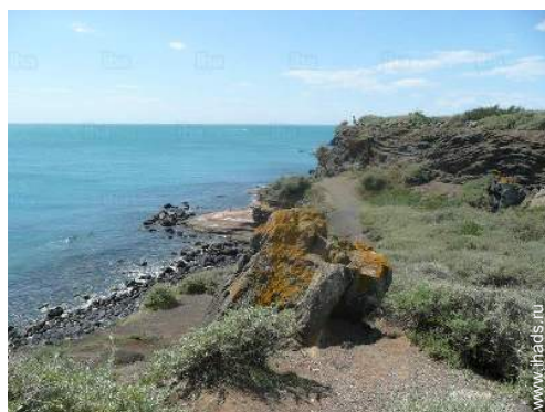
море в поле обзрения