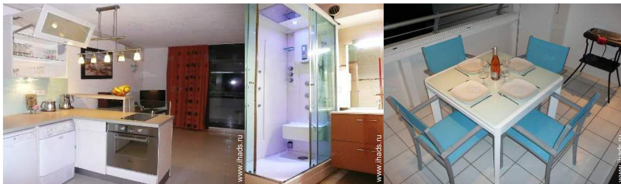
кухня американского типа