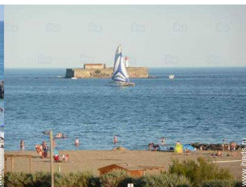
вид из квартиры