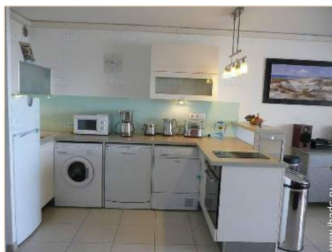
кухня американского типа