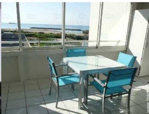
вид из квартиры