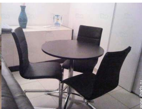
уголок приёма пищи