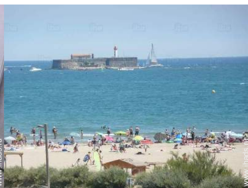
вид из квартиры