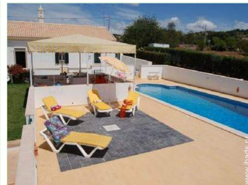
Установленные снаружи объекты