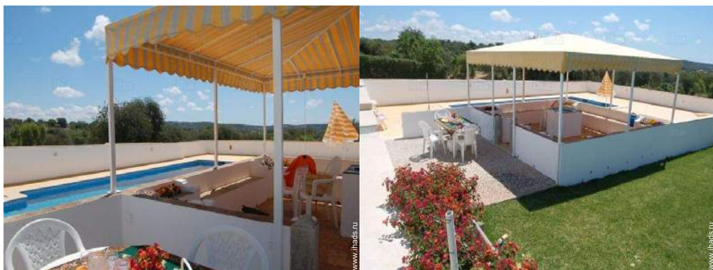
Наружные приспособления в распоряжении гостей