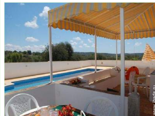
Наружные приспособления в распоряжении гостей

Песчаный пляж 15km Место для виндсерфинга 15km Места для серфинга 15km