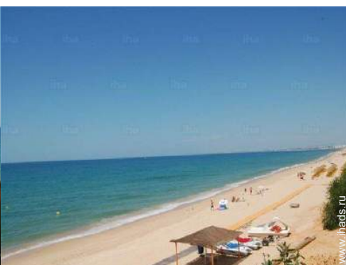
место для виндсерфинга