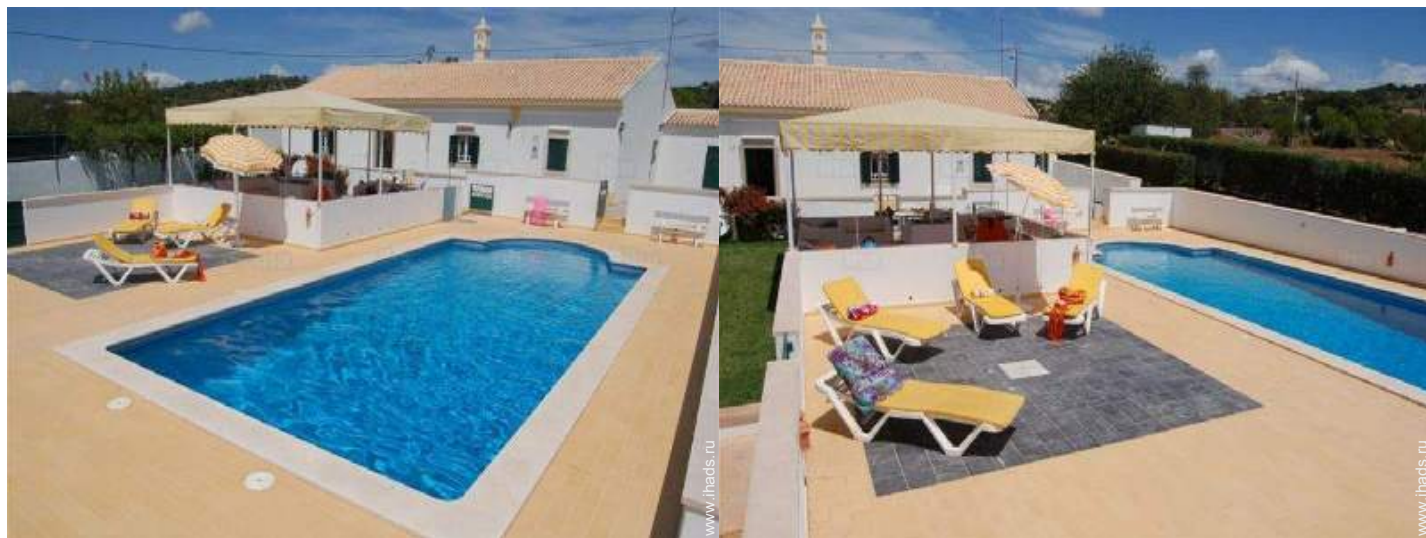
Установленные снаружи объекты