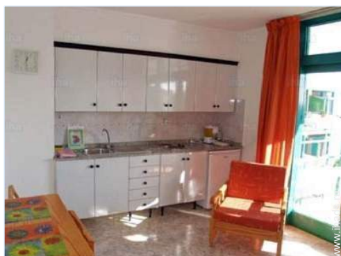
кухня американского типа

Бассейн во владении, вход по металлической лесенке, лягушатник, душ под открытым небом (открытый от '01 январь' до '01 январь')