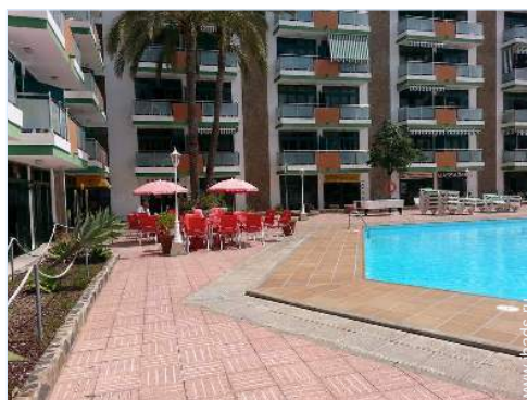
бассейн во владении