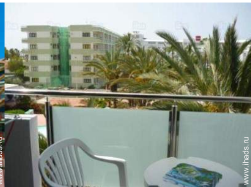
вид из балкона