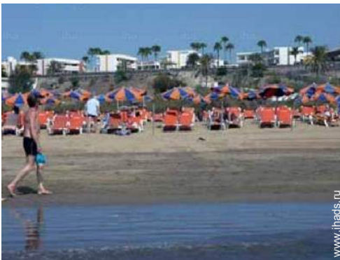
Оснащение для развлечений