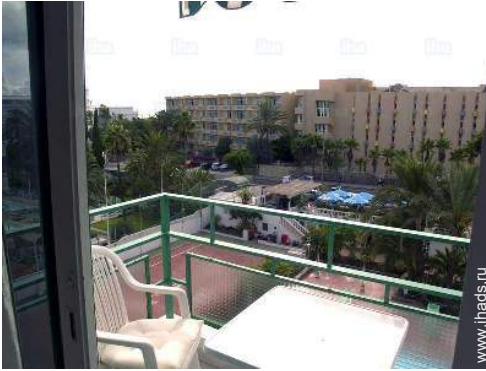
вид из квартиры