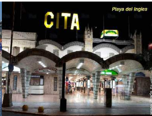
обустройство для развлечений