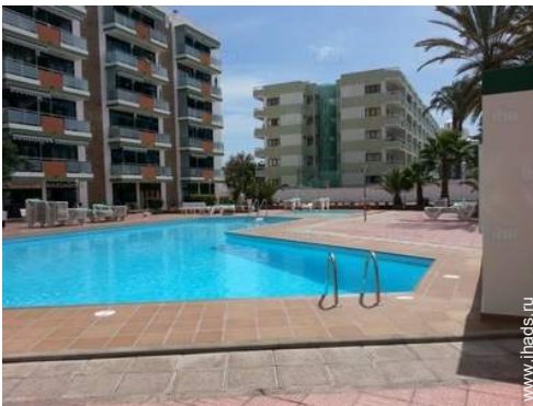
вид на бассейн