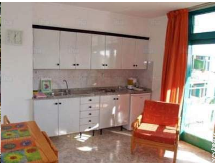
кухня американского типа