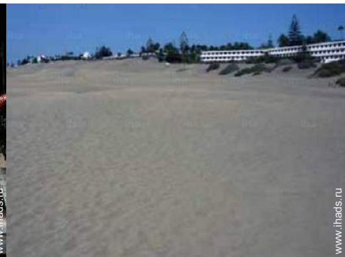
водные развлечения поблизости