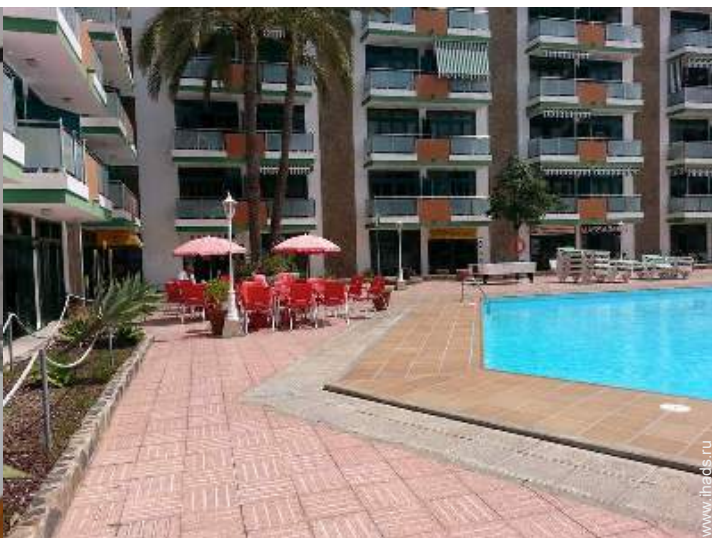
бассейн во владении