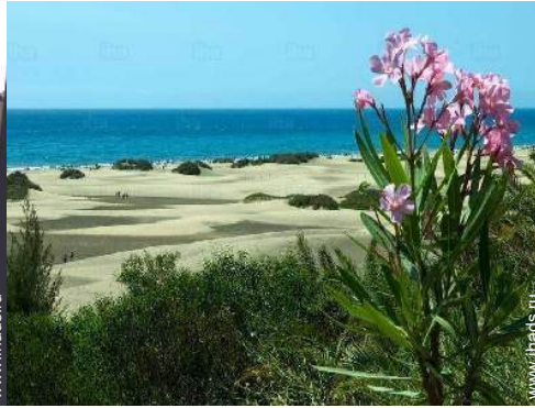
водные развлечения поблизости