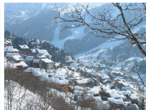
вид с воздуха