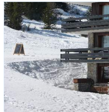
вид из балкона

Детский сад Автобусная остановка <50m Булочная 50m Близлежащие магазинчики <50m Универмаг 50m Аптека 2km