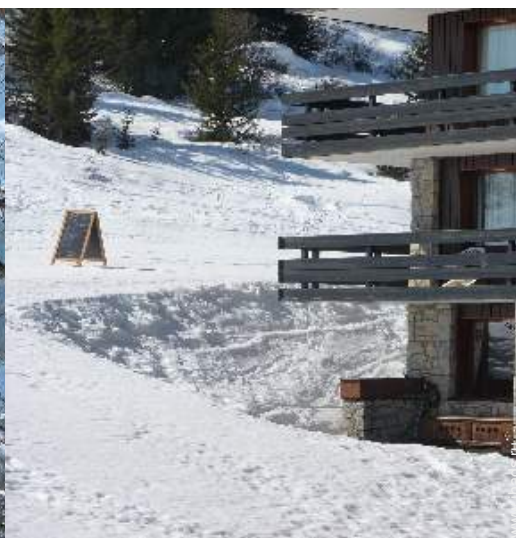
вид из балкона