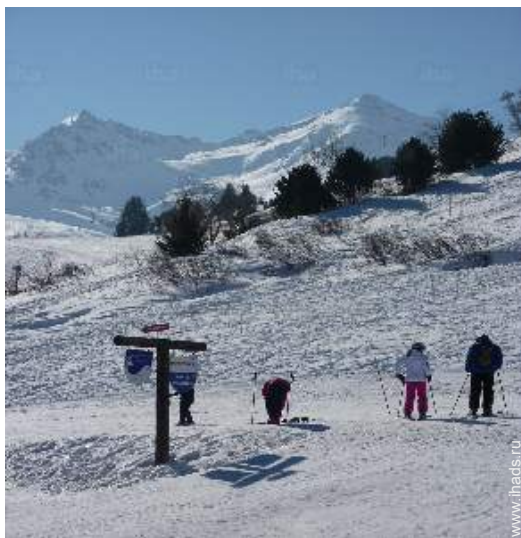
вид из балкона