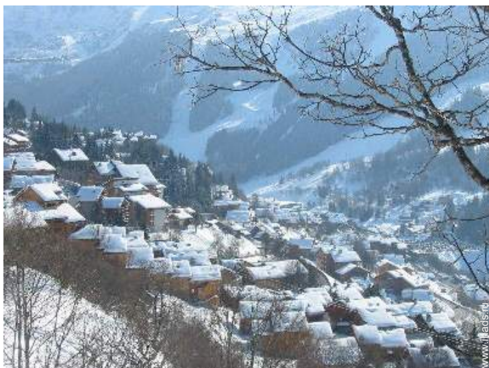
вид с воздуха