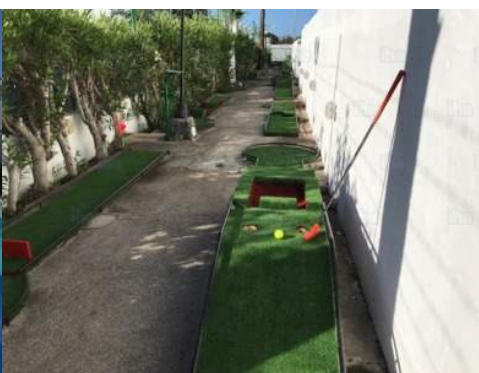
Оснащение для развлечений