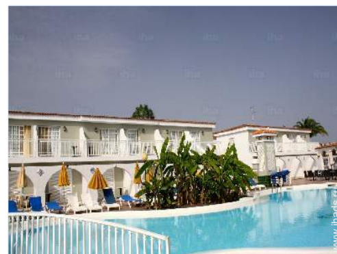
вид на бассейн