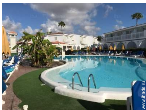
вид на бассейн