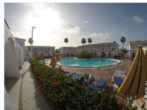
вид на бассейн