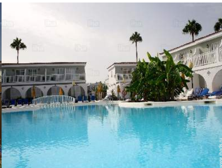
вид из бассейна