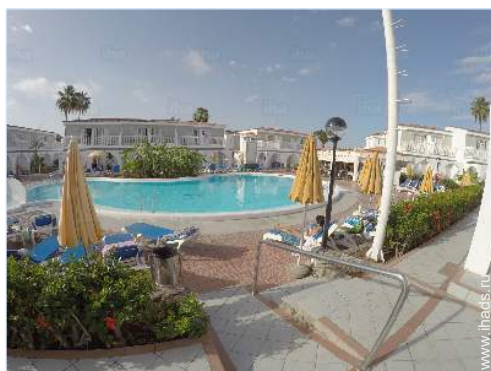
вид из бассейна