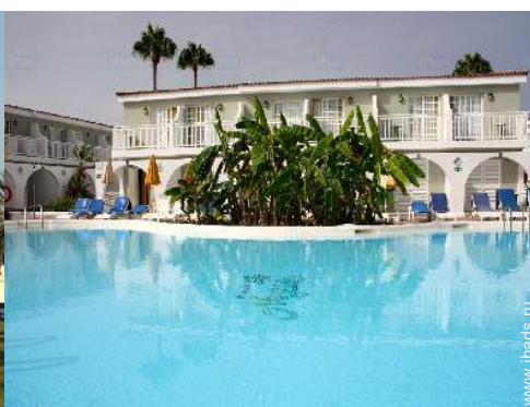
вид на бассейн