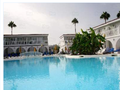
вид из бассейна