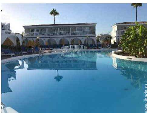
вид на бассейн