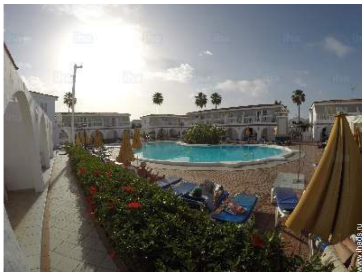
вид на бассейн