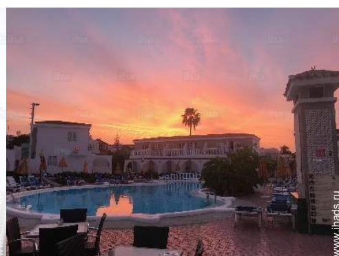
вид на бассейн